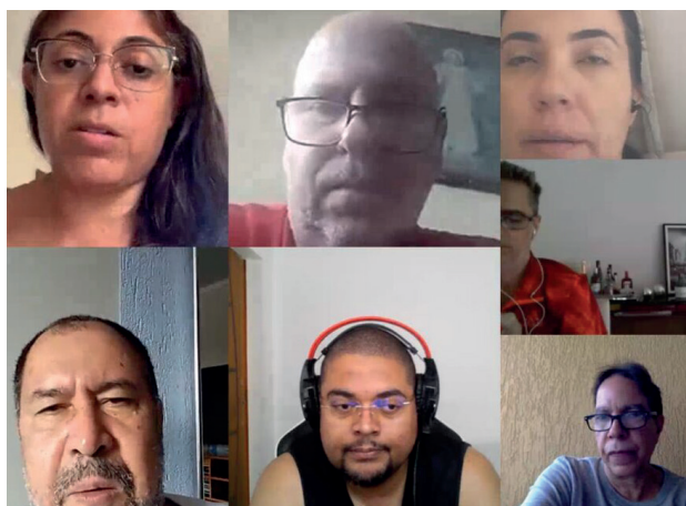
Em reunião no dia 14 de janeiro, o Sindicato cobrou o fortalecimento e cumprimento dos protocolos de segurança para o enfrentamento à variante Ômicron e Influenza.