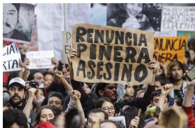
Chile, outubro de 2019: onda de protestos por mais igualdade

Argumentos distorcidos, dados incorretos ou fraudados foram detectados em estudos do