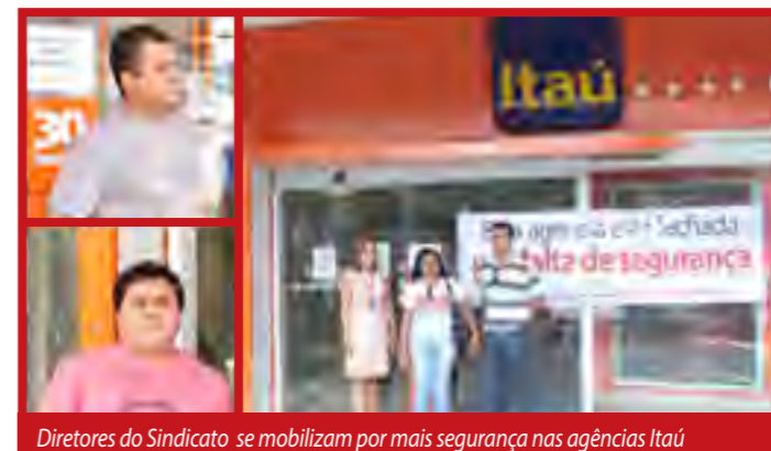
Diretores do Sindicato se mobilizam por mais segurança nas agências Itaú

que atormenta bancários, clientes e usuários. O Itaú foi a segunda instituição mais multada pela Polícia Federal durante a 100ª reunião da Comissão Consultiva para Assuntos de Segurança Privada (CCASP). O banco teve de pagar R$ 1.188.924,24 por descumprir a legislação.