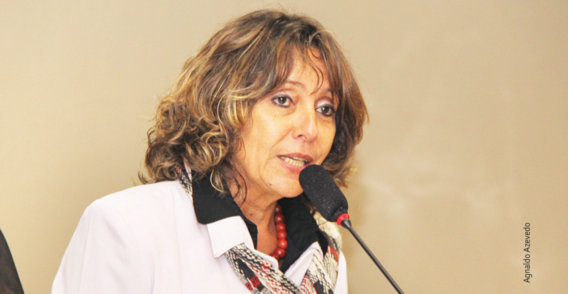
Erika Kokay - Deputada Distrital