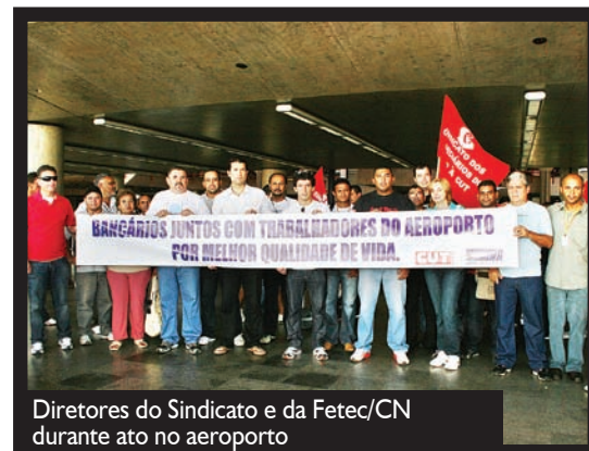
A CUT/DF e os sindicatos encaminharam a pauta à direção da Infraero e cobraram solução urgente para todos os problemas apontados pelos trabalhadores.

Os trabalhadores do aeroporto cobram respeito aos direitos trabalhistas, cumprimento dos acordos coletivos de cada categoria, condições dignas de trabalho, transporte e alimentação a custo justo, estacionamento gratuito e seguro, fim do assédio moral praticado pelos gestores, entre outras reivindicações.